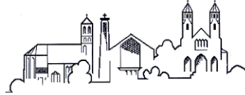
St. Mariä Himmelfahrt mit St. Clemens Maria Hofbauer